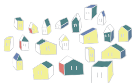
UN GROUPEMENT DÉPARTEMENTAL ANNUEL