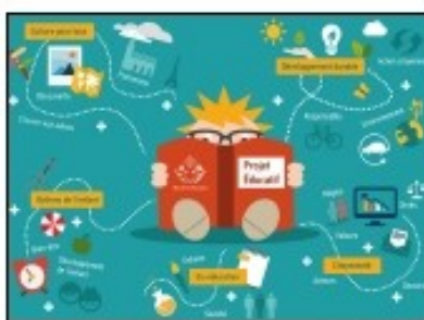
Initiez vous à de nouvelles matières.