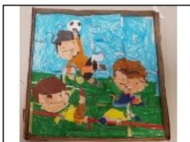
Faites des puzzles.

Pour se divertir à la maison : L'ennui vous guette, voici pour vous une petite compilation de musées accessibles en ligne. C'est gratuit ! ☐ Les musées qui participent à ce dispositif sont 14. Ci-joint le lien : http://parismuseescollections.paris.fr/fr