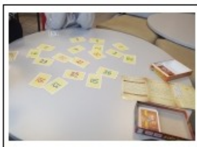
Jouez avec vos enfants.