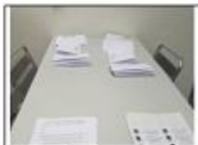
Préparation des paquets d'attestations par Farida avant la distribution.