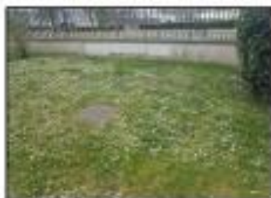
Pelouse tout près du centre social.